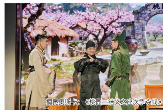
桐昆奥斯卡:《桃园三结义之座次争夺战》

次争夺战》荣获“桐昆奥斯卡”奖。桃园结义的故事想必大家都不陌生吧？可今天的“新三人”要争一争排名呢！比德行他们锦旗在手，比颜值他们器宇轩昂，比武力……哎哟喂~“关二爷”咋给“刘大哥”来了个过肩摔呀！欢声笑语中他们终于定下“座次”，顺利完成了新时代“结义”。节目创意新颖，将古典名著与现代职场巧妙结合，三人通过德智体美劳多方面比拼划分座次，笑点密集又不失思想深度，展现了年轻员工的创造力与团队协作精神。