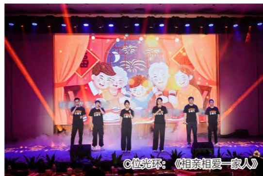
C位光环:《相亲相爱一家人》

相爱一家人》作为最后一个节目，不负众望获得“C位光环”奖。这首经典歌曲在他们的重新演绎下，唱出了桐昆大家庭的温暖与团结，为整场活动画上圆满句号。当“因为我们是一家人，相亲相爱的一家人”的旋律响起，现场观众自发打开手机灯光随节奏摇摆，形成一片星海，场面温馨感人。