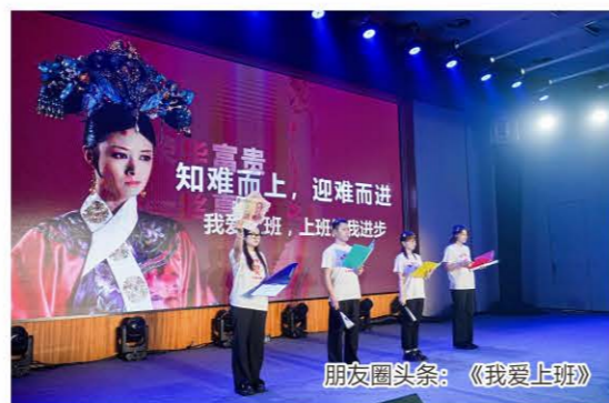
朋友圈头条:《我爱上班》

外贸部四人表演的诗朗诵《我爱上班》以其新颖创意和幽默表达荣获“朋友圈头条”奖。节目以诙谐方式表达对工作的热爱，既贴近员工生活又充满正能量，演员们以夸张而不失真实的表演，将日常工作以诙谐的形式呈现，引发观众强烈共鸣。